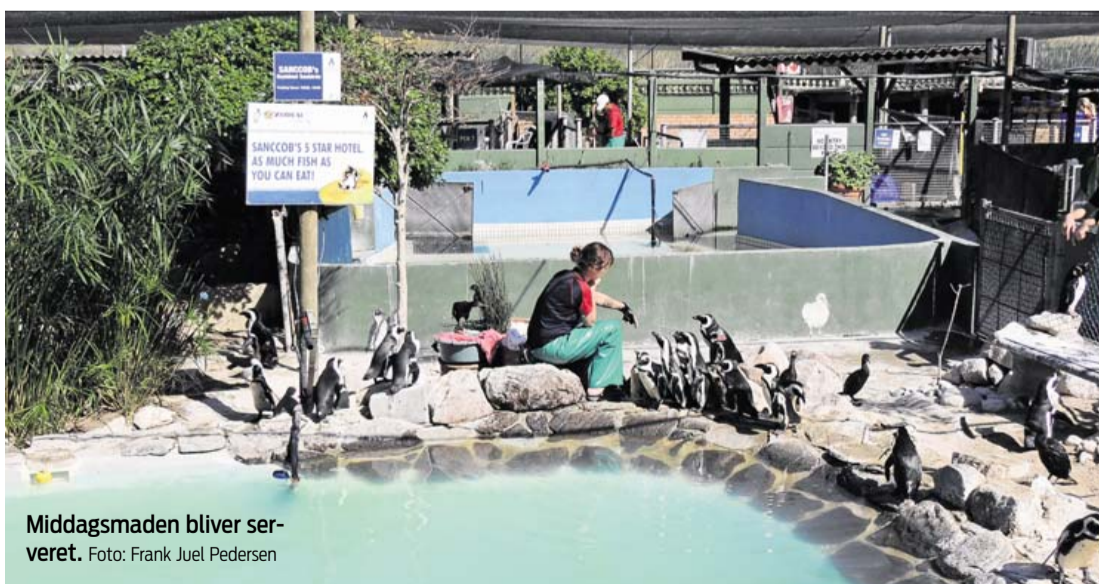
Middagsmaden bliver serveret.

får ofte skader på benene ude i naturen på grund af folkets efterladenskaber såsom glasskår og andre skarpe genstande.